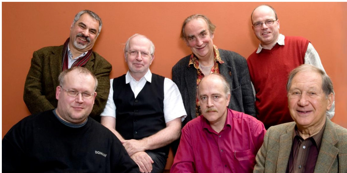
Der KORSO - Vorstand

Der KORSO e.V. ist als gemeinnützig anerkannt und parteipolitisch unabhängig